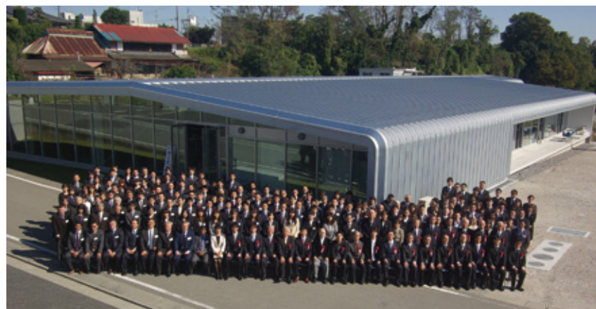
第2工場竣工式 深谷市長を来賓に海外支社代表を迎えての集合写真