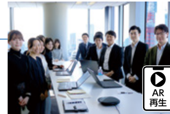
本社営業部門は多様な強みを持つメンバーが支援する