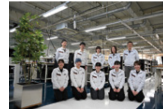
製品の組み立てを行う部門は相談しやすい環境づくりに取り組んでいる